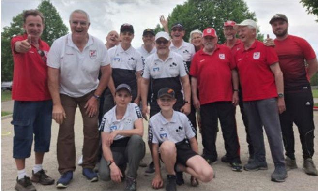
Pétanque-Spieler des DJK SC Neuses und des PC Burgthann 2 vor dem Pokalspiel

schied. Wir wünschen unseren Freunden aus Burgthann viel Glück für die nächsten Pokalrunden und freuen uns schon jetzt auf das nächste Wiedersehen!