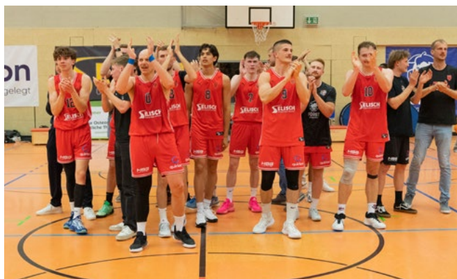
Stolz präsentierte sich nochmals das komplette Team den Zuschauern