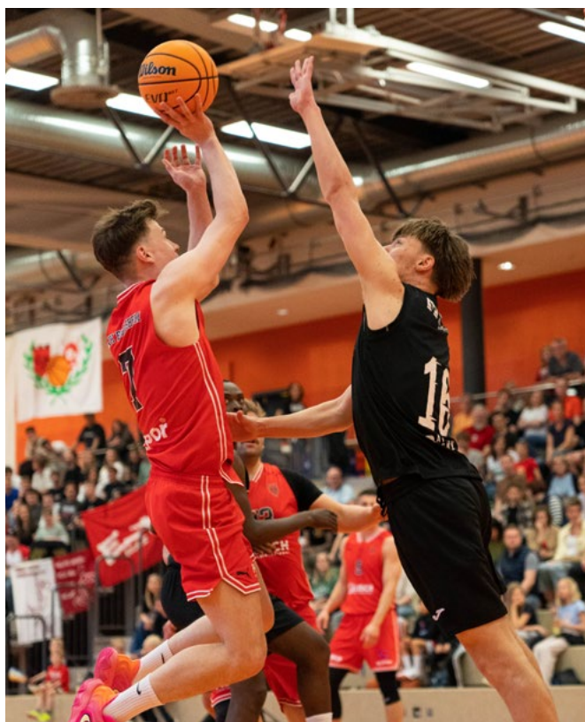
Ertl war auch vom Spitzenreiter nicht zu halten