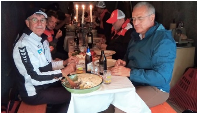
Gemeinsames Essen in der Gewitterpause in der Kugelklocker-Garage

Liebe „Neuseser“ und Gäste, der DJK Sport-Club Neuses veranstaltet am Freitag, den 12.06.2026, ab 16:30 Uhr: