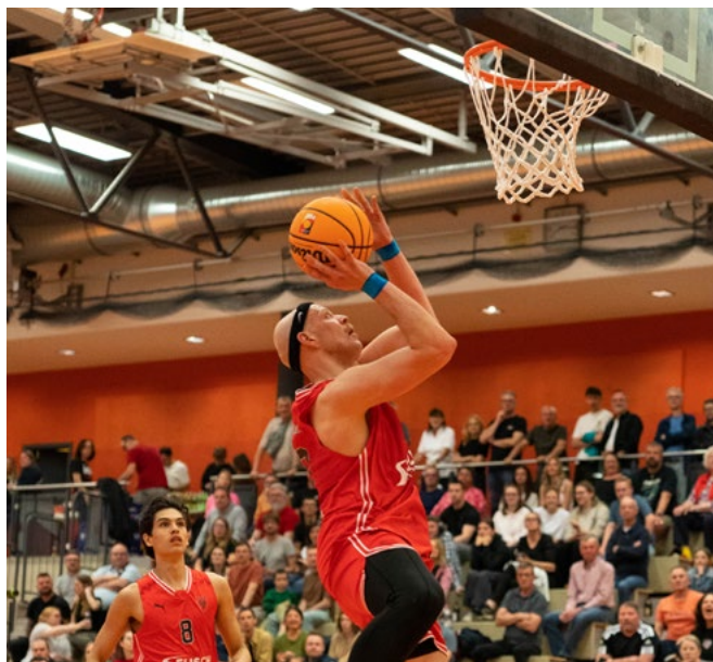
Rybyy setzte sich immer wieder unter den Korb durch