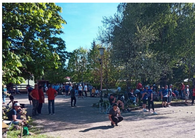
Emsiger Betrieb bei der BM im Triplette in Furth im Wald