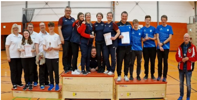
Die Podestplätze in der Bezirksklasse: BS Wirsberg, BSC Reuth, Frankonia Neuses II

Weitere Info zum Verein, Trainingszeiten, Schnupperschiessen etc. unter www.frankonia-neuses.de