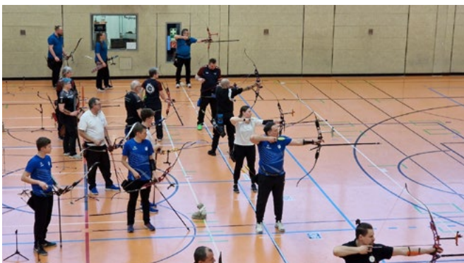
An der Schießlinie darf pro Mannschaft immer nur 1 Schütze stehen, nach zwei Pfeilen erfolgt fliegender Wechsel.