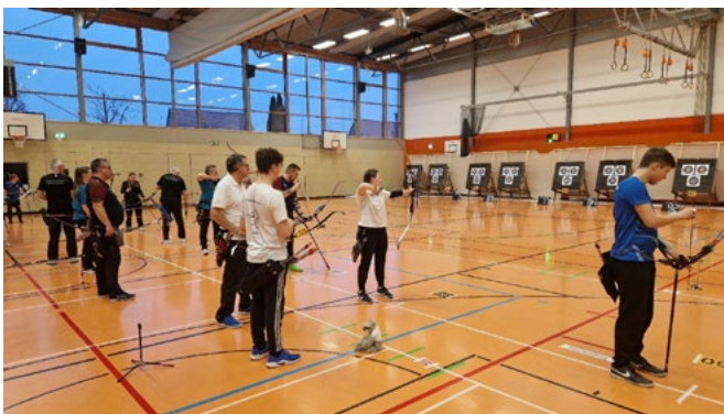
Die Eggerbach-Halle bewährte sich als Austragungsort für Wettkämpfe im Bogenschießen