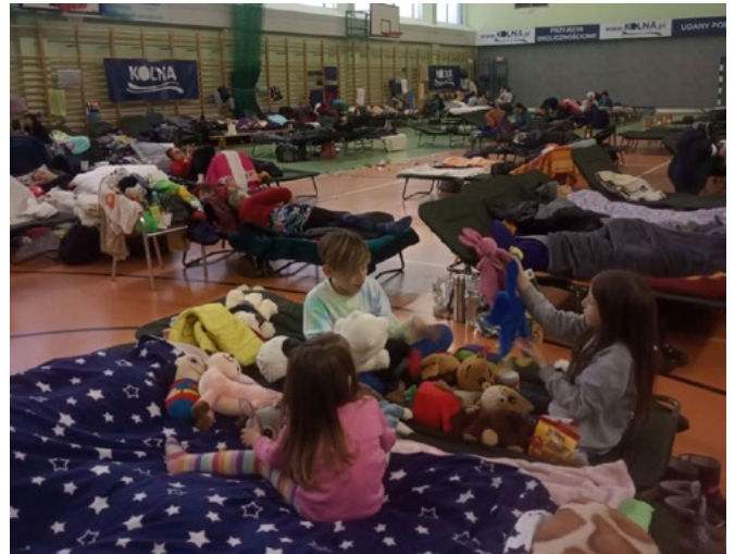
Eine Woche in der Sporthalle

Dann machten wir einen sehr harten und beängstigenden Weg, dem Krieg zu entkommen, überquerten die Grenze, 7 Tage in einem Auto, dann nahm in Polen ein schrecklicher Autounfall unser einziges Auto weg (aber Gott sei Dank blieben wir alle am Leben). Wir wohnten eine Woche in einer Sporthalle. Und wir fühlten uns, als hätten wir unser Zuhause verloren, wir hätten unser Land verloren und wir hätten unser Auto verloren, Freunde, Verwandte ... alles. Das Einzige was wir hatten, war unser Vertrauen in Gott.