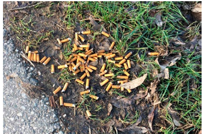
Foto vom 12.1.22 am Feldweg Abzweig von der St. Martin-Str. Richtung Feldweg an der Brettlig

Eine enorme Umweltbelastung, die durch Gedankenlosigkeit hervorgerufen wird. Denken wir an unsere Kinder und Enkelkinder, denen wir diesen Müll hinterlassen. Bitte entsorgen Sie Zigarettenstummel und sonstigen Müll auf bedarfsgerechte Art und Weise.