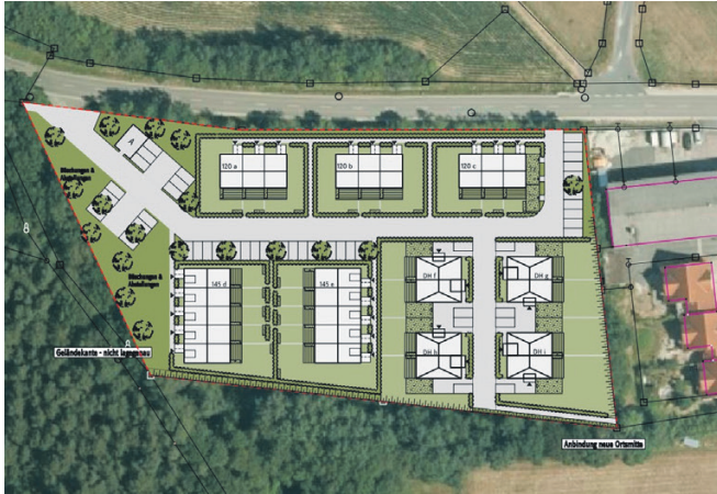
Übersichtsplan Projekt Langer Weg, Bammersdorf

Nach der überaus positiven Resonanz aus der Bürgerversammlung soll in der nächsten Sitzung des Marktgemeinderates das Projekt auf der Tagesordnung stehen. Zu behandeln ist zunächst die Änderung des Flächennutzungsplanes, in dem die als Mischgebiet ausgewiesene Fläche in ein Wohngebiet umgewandelt werden soll. Im zweiten Schritt wird das Bebauungsplanverfahren eingeleitet.