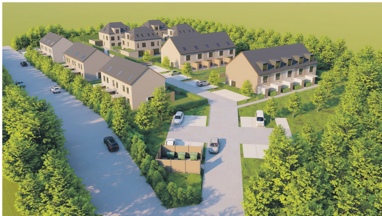
Ansicht NWest, Ortseingang Bammersdorf