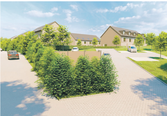
Ansicht West, Ortseingang Bammersdorf

Für die Marktgemeinde und die Ortschaft Bammersdorf ist die Entwicklung des ehemaligen Industriegeländes sicherlich ein Gewinn. Damit einher geht die Beseitigung eines Städtebaulichen Missstandes, verbunden mit der Schaffung von Wohnraum zu bezahlbaren Preisen. Zudem sollen Einheimische Bewerber für eine bestimmte Zeit auf Grundlage der gemeindlichen Richtlinien besonders berücksichtigt werden. Dies ist wichtig zur Deckung des örtlichen Bedarfs an Wohnraum und trägt gleichzeitig zur Integration in die Bürgerschaft bei.